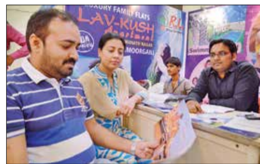
लव कुश अपार्टमेंट का स्टॉल।