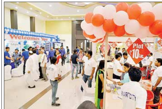
जागरण प्रापर्टी फेयर में स्टाल पर जानकारी लेते लोग।