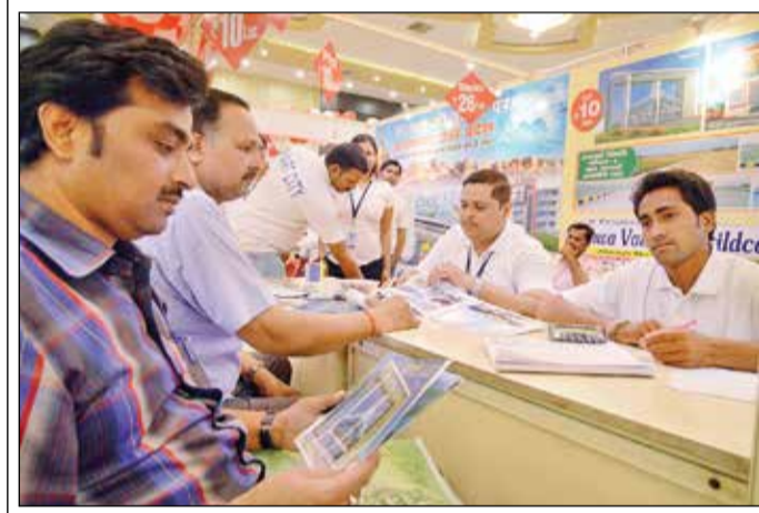
स्मार्ट सिटी का स्टॉल।