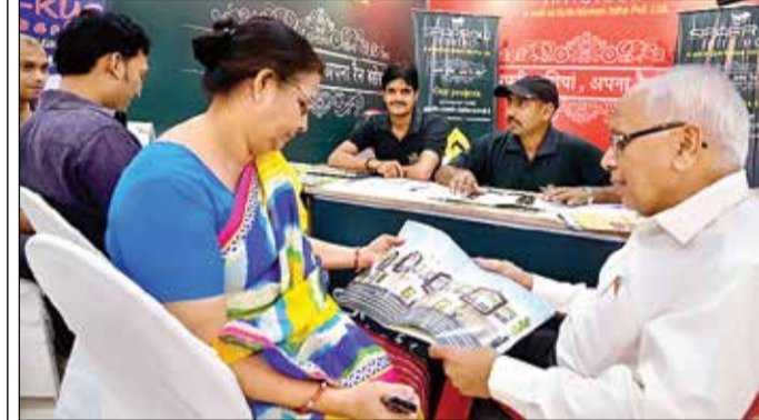
स्पेरो इंफ्राटेक का स्टॉल।