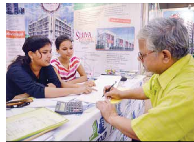
रोमा का स्टॉल।

शहर में इस तरह के आयोजन बराबर होने चाहिए। सबका सपना होता है एक ऐसा