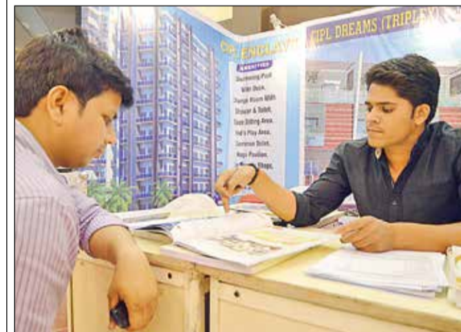
सेनित का स्टॉल।