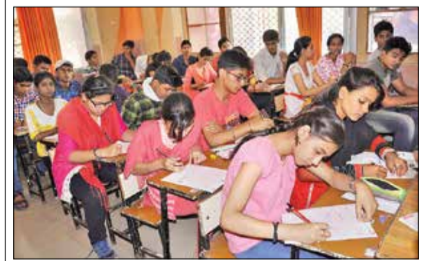
आइआईटी सीजन-3 : डॉलिम्स रामकटोरा में शामिल परीक्षार्थी।