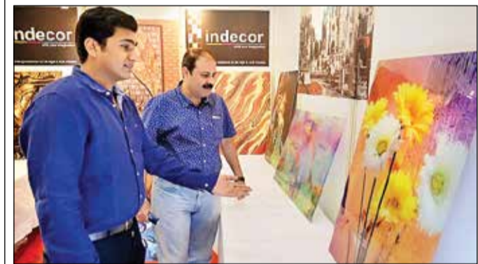
इंडीकोर का स्टॉल।