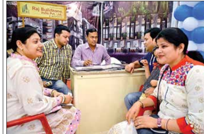
राज बिल्ड जोन का स्टॉल।